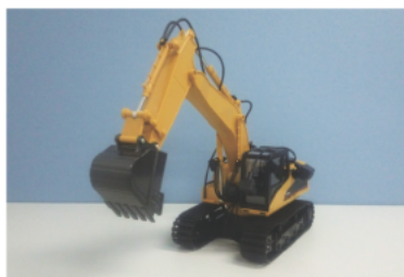
建設機械にカメラを4つ搭載